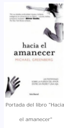
Portada del libro "Hacia el amanecer"